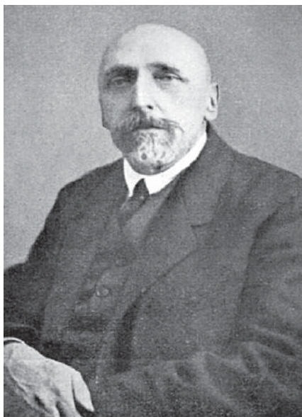
Рис. 1. Лахтин Михаил Юрьевич (1928 г.).

М.Ю. Лахтин в 1890 г. окончил 4-ю Московскую гимназию и поступил на отделение естественных наук физико-математического факультета Императорского Московского университета (ИМУ), который окончил в мае 1894 г. с дипломом 1-й степени. В том же году по его просьбе М.Ю. Лахтин был зачислен на третий курс медицинского факультета ИМУ и 16 октября 1897 г. был удостоен звания лекаря с отличием. В его свидетельстве об окончании медицинского факультета есть приписка: «За сочинение на тему “Новейшие направления в терапии инфекционных болезней” удостоен Медицинским факультетом 11 декабря 1895 г. золотой медали» 3 . Сочинение, удостоенное золотой медали, было написано во время работы М.Ю. Лахтина в клинике профессора В.Д. Шервинского, а использованные в нем материалы стали основой его первой публикации – статьи «Новейшие направления в учении о невосприимчивости» [5], которая представляет собой критический анализ трудов об иммунитете. Вслед за этой статьей в журнале «Врачебные записки» появились два его реферата: «История проникновения сифилиса в Европу» [6] и «Токсины и антитоксины по учению Ру, Мечникова и др.» [7]. Первые публикации свидетельствуют о том, что со студенческих лет главным направлением научных интересов М. Лахтина была история медицины. В этих работах Лахтин именовался как Михаил