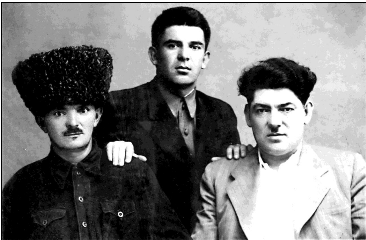
С родными братьями